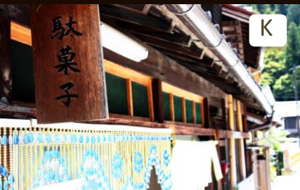
町の子もど達が集まる駄菓子屋。Children's favorite shop where sells cheap sweets.