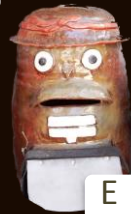
His name is Q-chan. The name comes from this stationary shop's name of "Hakkyu".