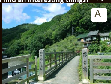
Wooden bridge "Ochiai-bashi". "Ochiai" means meeting. 2 different rivers meet in here.