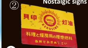
旧田口家にあるシェル石油看板 Shell oil company's sign at former Taguchi's residence.