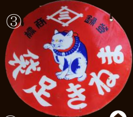
スズマン本舗にあるまねき足袋看板 Japanese socks's sign at Suzuman Honpo.