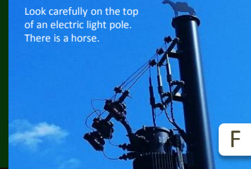
Look carefully on the top of an electric light pole. There is a horse.