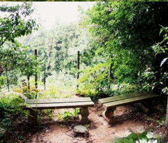
↑ 足助植物園内（コース内）の様子 The greenery heal you.