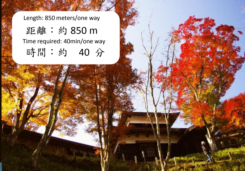
↑ 足助城の秋 Autumn season