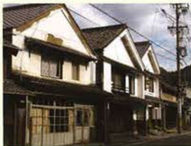
●連続する妻入家屋

明治44年（1911）に国鉄中央線が開通すると、物資の輸送基地としての機能は次第に衰退しますが、その後も足助は東加茂郡の中心として歩み続けました。